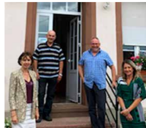
NICOLE TRISSE, Députée de la 5 ème circonscription de la Moselle, est venue nous rendre visite le 10 juillet 2020.